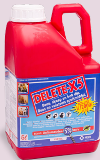
G3279 (Wet 36/1947)