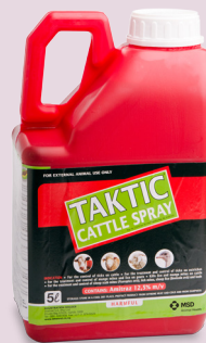
G2535 (Wet 36/1947)