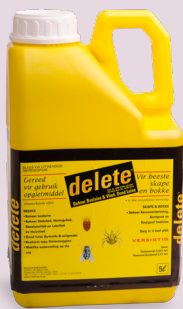
G2815 (Wet 36/1947)