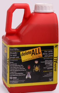
G2837 (Wet 36/1947)